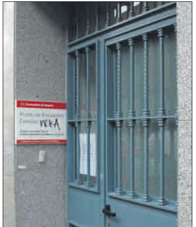
Entrada al Punto de Encuentro Familiar en la Calle Carretas