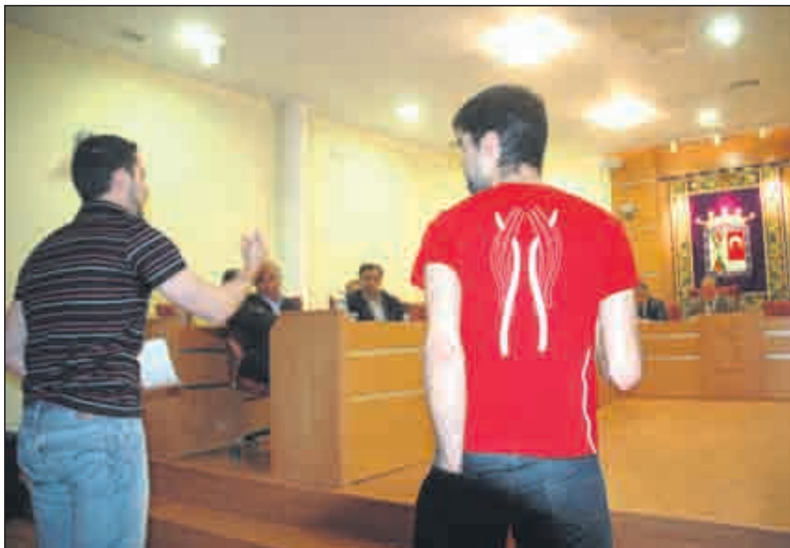
Los jóvenes expusieron sus quejas en el transcurso del último pleno

Los jóvenes personados en el salón de plenos aseguraron ser de todas las condiciones políticas, aunque una portavoz de las que hablaron