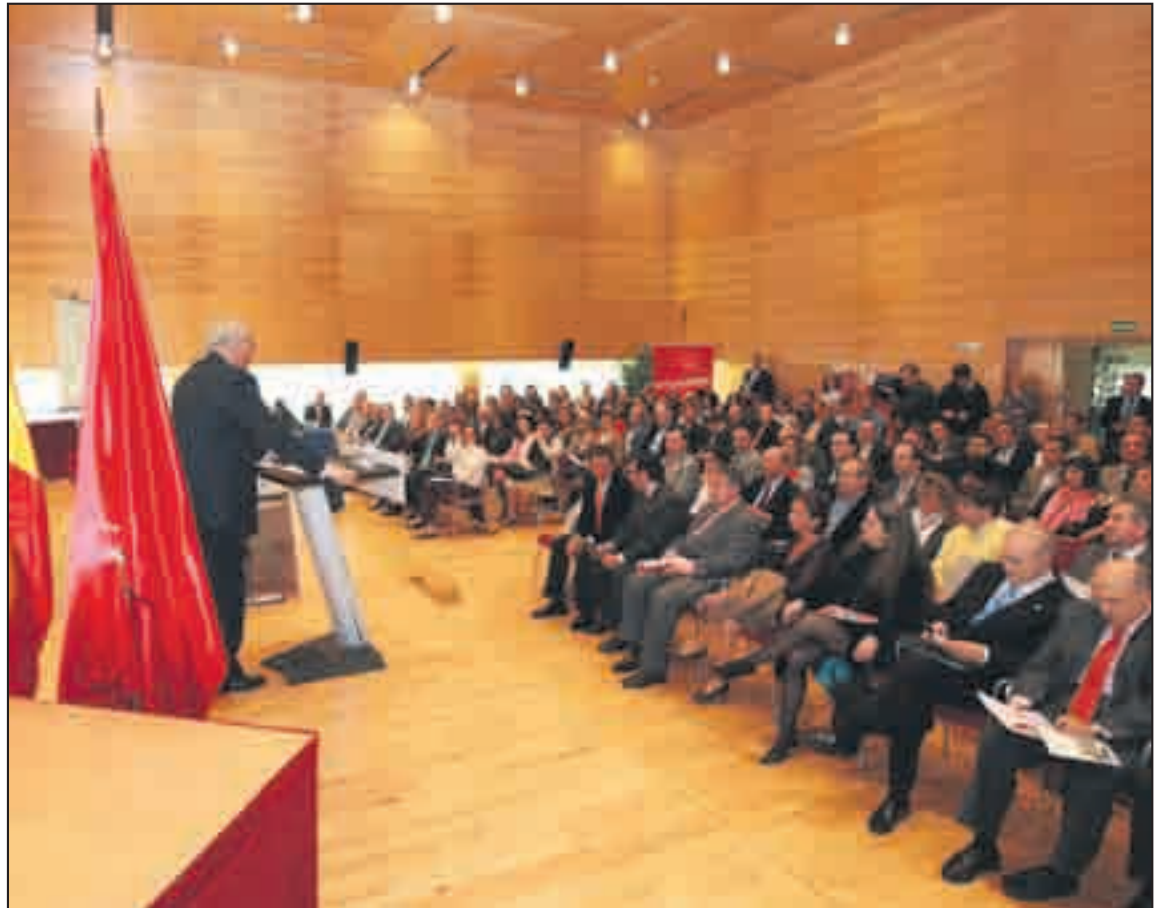
Aspecto del salón de plenos en la presentación de la marca "Madrid Excelente"