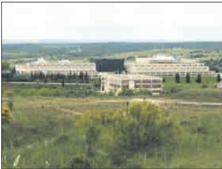
Instalaciones de la BP Solar en Tres Cantos

Un total de 480 puestos de trabajo se verán afectados por el cese de actividad productiva de la empresa BP Solar, de las filiales que tiene en Tres Cantos y San Sebastián de los Reyes. Concretamente, lo que afecta a Colmenar Viejo de forma más directa es la ubicada en Tres Cantos, que destruirá 280 puestos de trabajo, de los que un 20%, especialmente en el área de servicios, son vecinos del municipio. IU llevó al pleno una propuesta de apoyo a todos los trabajadores afectados por este ERE, mostrando el apoyo de la corporación a los mismos, algo que fue refrendado por todos los grupos municipales. El portavoz del grupo criticó que al pleno de abril solamente se llevara como contenido las propuestas de su grupo, ya que la sesión se encontraba vacía de puntos, solicitando el respaldo de las administra-