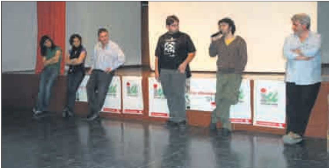
El público mantuvo un coloquio con los invitados al final de las proyecciones