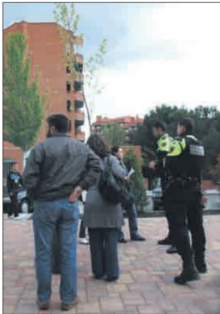
La policía identificó a algunos de los jóvenes

La manifestación, que comenzó en la avenida de Colmenar, frente al Zoco, transcurrió tranquilamente hasta que intervino la Policía Local, cuando un agente solicitó la identificación de los responsables de la marcha, después de que los manifestantes permanecieran un minuto sentados en un paso de peatones. La actitud "chulesca", como la definió más de uno, de este policía y las malas formas en las que se dirigió a los responsables, crisparon la marcha y llevaron a los manifestantes a proferir gritos de "esto nos pasa con un gobierno facha". Pero aquí no finalizó la coacción policial, ya que al llegar la manifestación a la plaza de la Peseta, de nuevo los agentes trataron de desviar a los manifestantes por la mediana, cuando disponían de autorización para caminar por la avenida de los Encuartes hasta el Ayuntamiento. A pesar de asegurar en todo momento que ellos obedecían órdenes, tuvieron que intervenir concejales del PSOE e