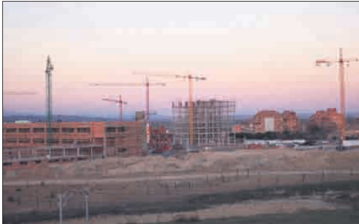
Sector del Nuevo Tres Cantos cercano a las parcelas de las viviendas del Plan Joven